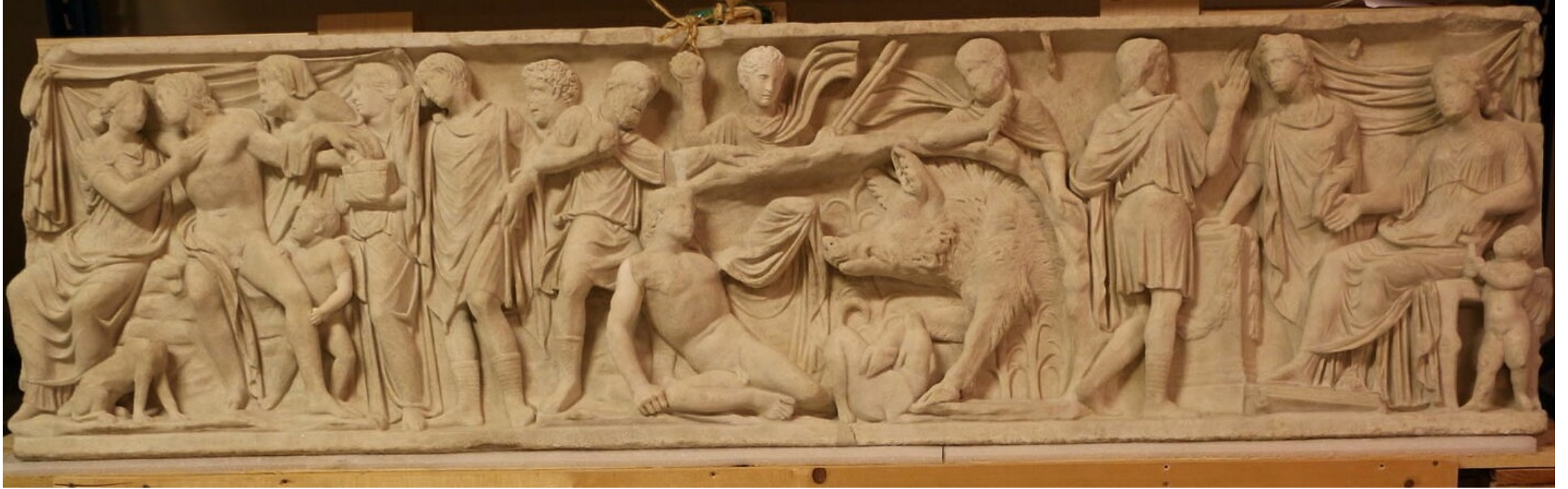
En haut : sarcophage, Paris, Louvre, Ma 347 (MR 695), vers 140-160 ap. J.-C. En bas : Rome, Palazzo Rospigliosi, vers 160-170 ap. J.-C.