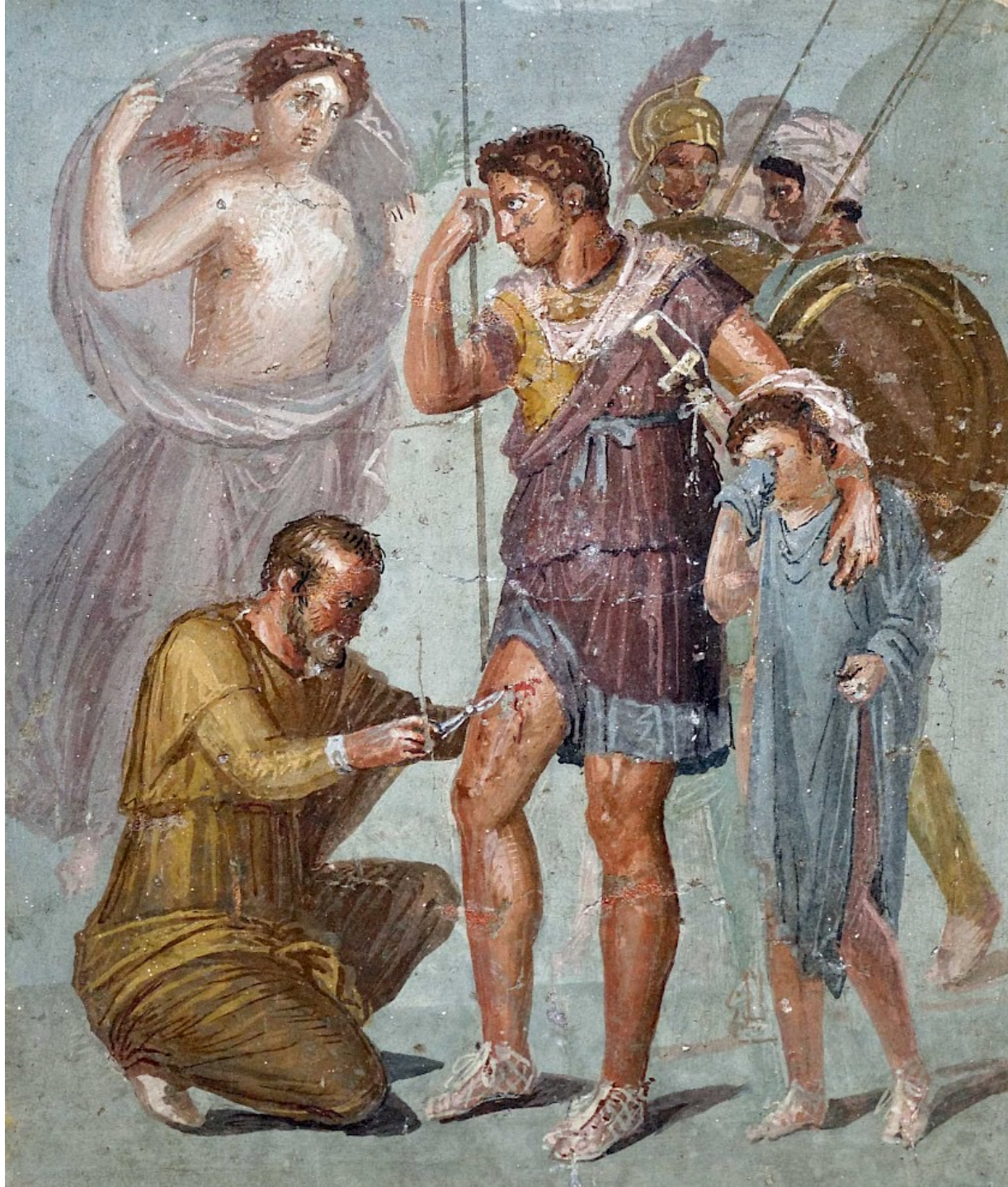
Énée blessé, Pompéi VII.1.47 (Casa di Sirico), triclinium 8, mur nord-est, MAN 9009.