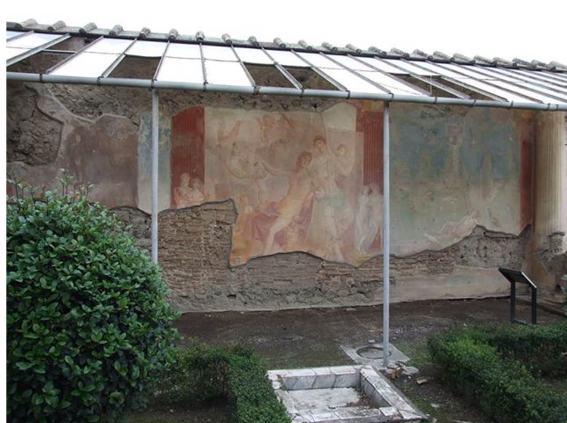
Pompéi VI.7.18, Maison de M. Asellinus / Maison d'Adonis, péristyle.