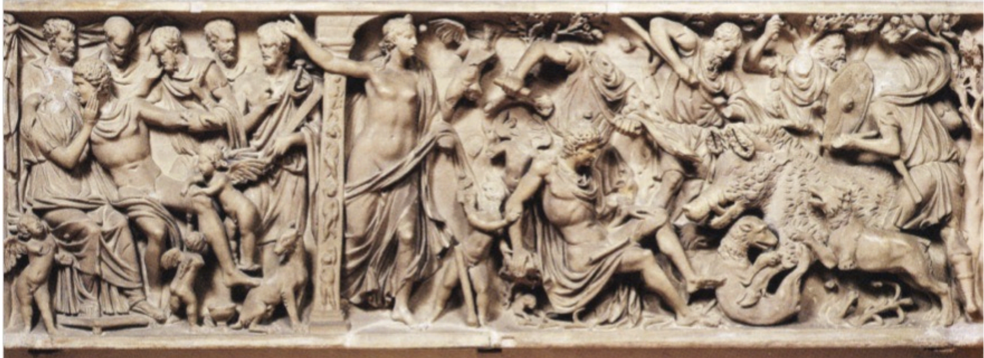
En haut : Mantoue, Palais ducal, vers 190. En bas : sacristie de la cathédrale de Blera, vers 200.