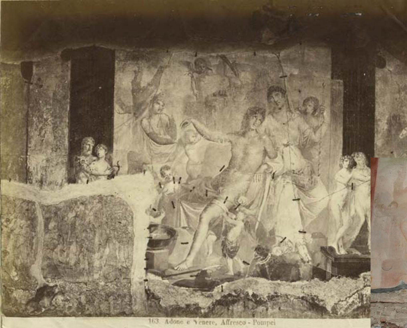
163. Adone e Venere, Affresco - Pompei

Pompéi VI.7.18, fresque de la mort d'Adonis.