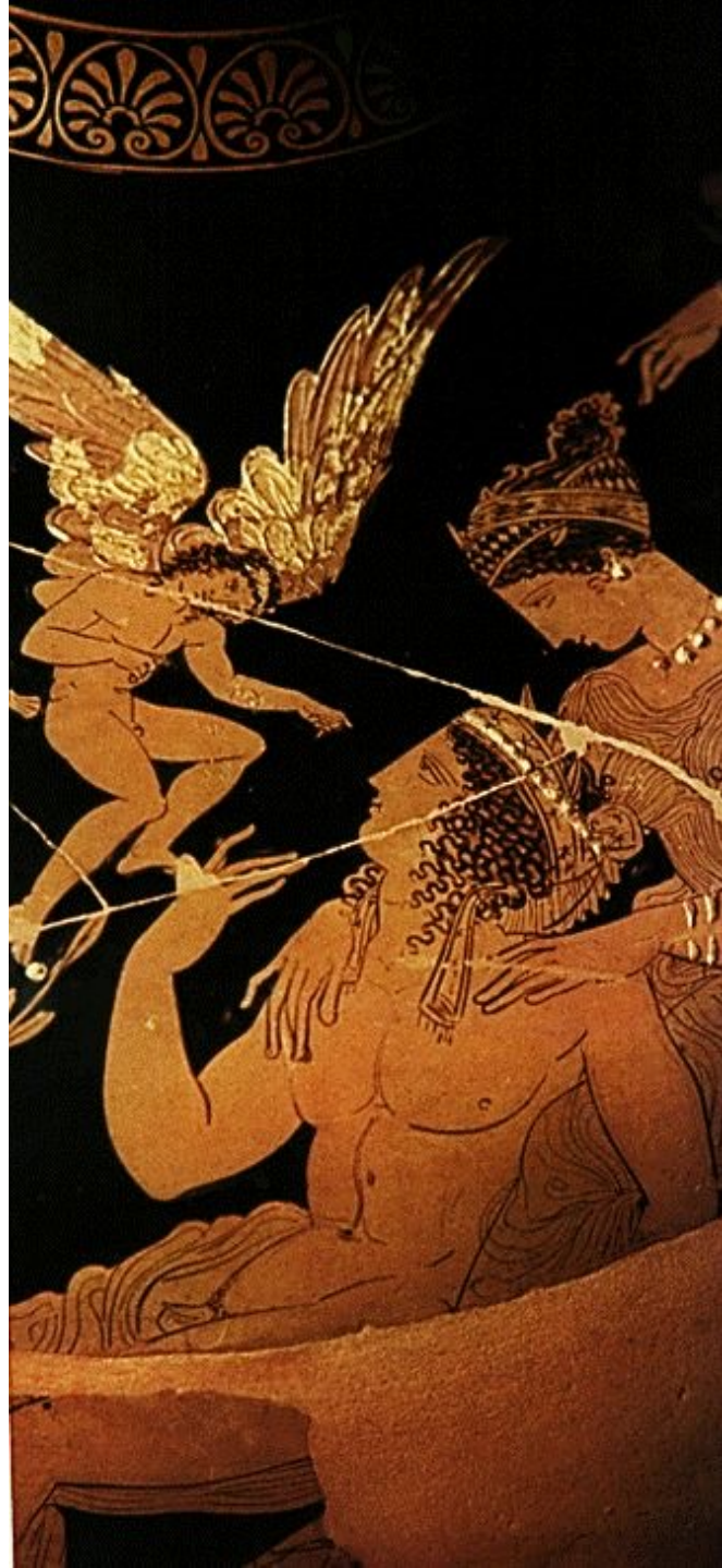
Hydrie attique à figures rouges, attribuée à Meidias, Florence, Museo archeologico, 81948, vers 410 av. J.-C (détail).