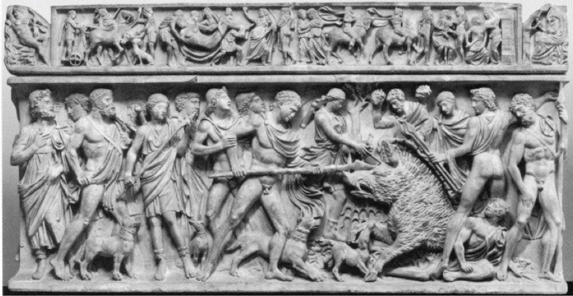
Sarcophage représentant la chasse au sanglier de Calydon, vers 180-190. Rome, Palazzo Doria Pamphilj.