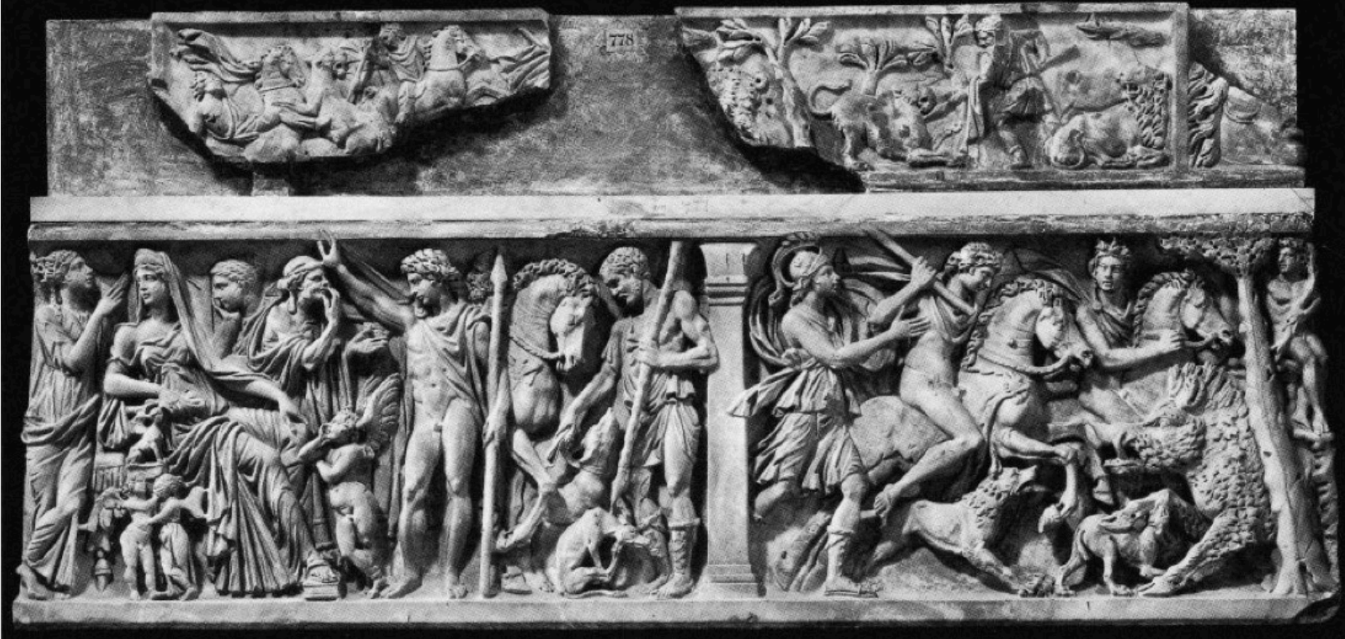
Sarcophage représentant Hippolyte et Phèdre, début IIIe s., Vatican, Museo Gregoriano Profano.