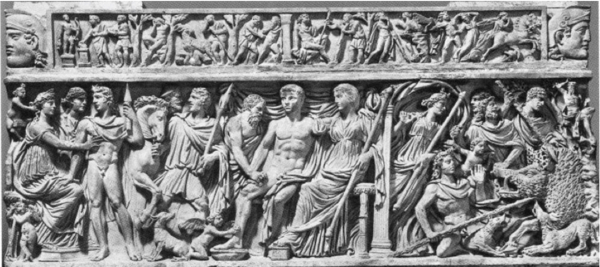
Sarcophage représentant Adonis, vers 220. Vatican, Museo Gregorio Profano.