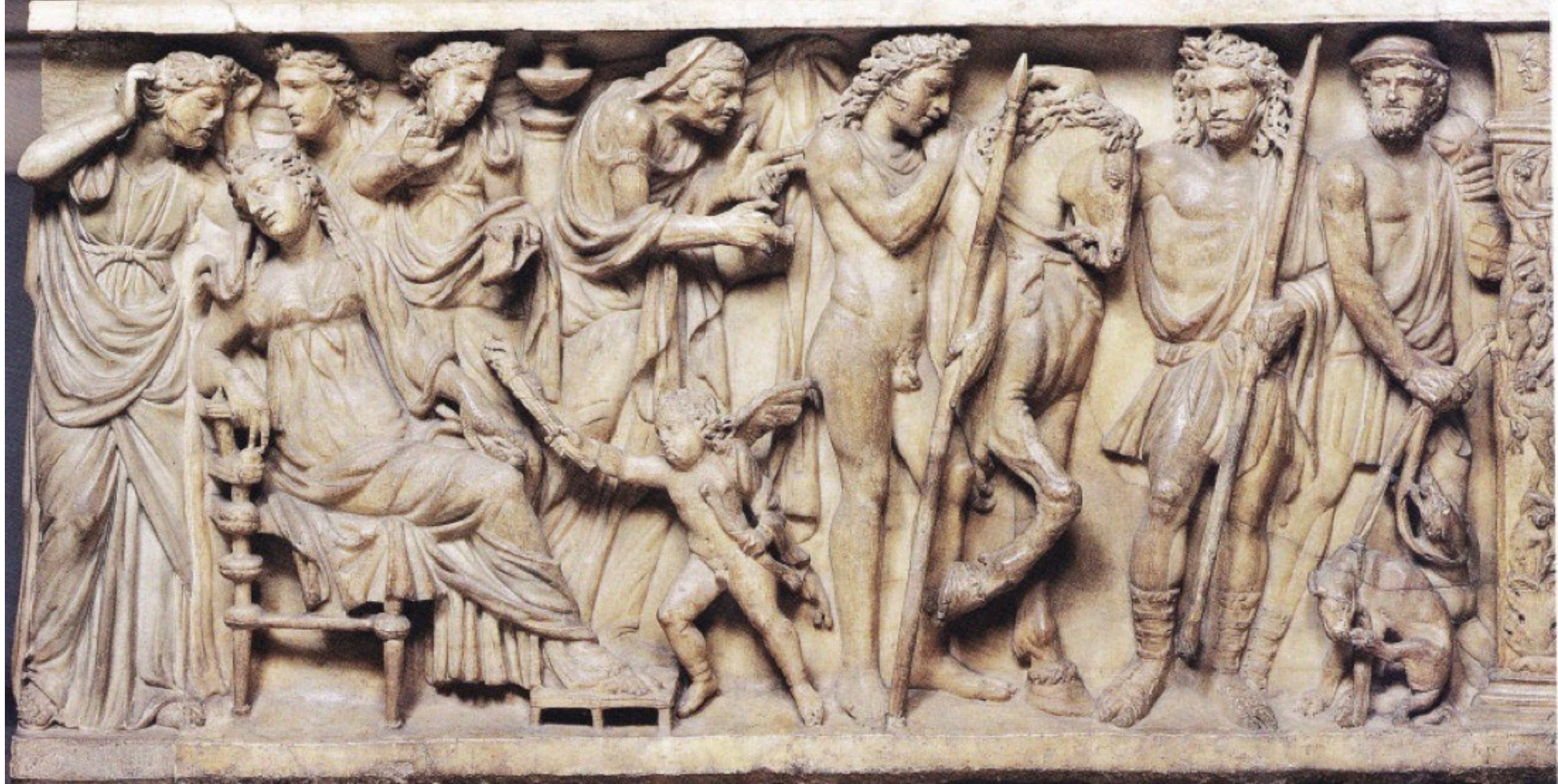
Sarcophage représentant Hippolyte et Phèdre, début IIIe s. Florence, Galerie des Offices.