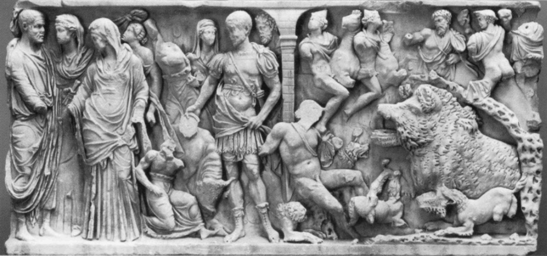
Scènes de vita humana et mort d'Adonis. "Sarcophage Rinuccini", Berlin, Staatliche Museen Preussischen Kulturbesitz, 1987.2. Vers 200-210.