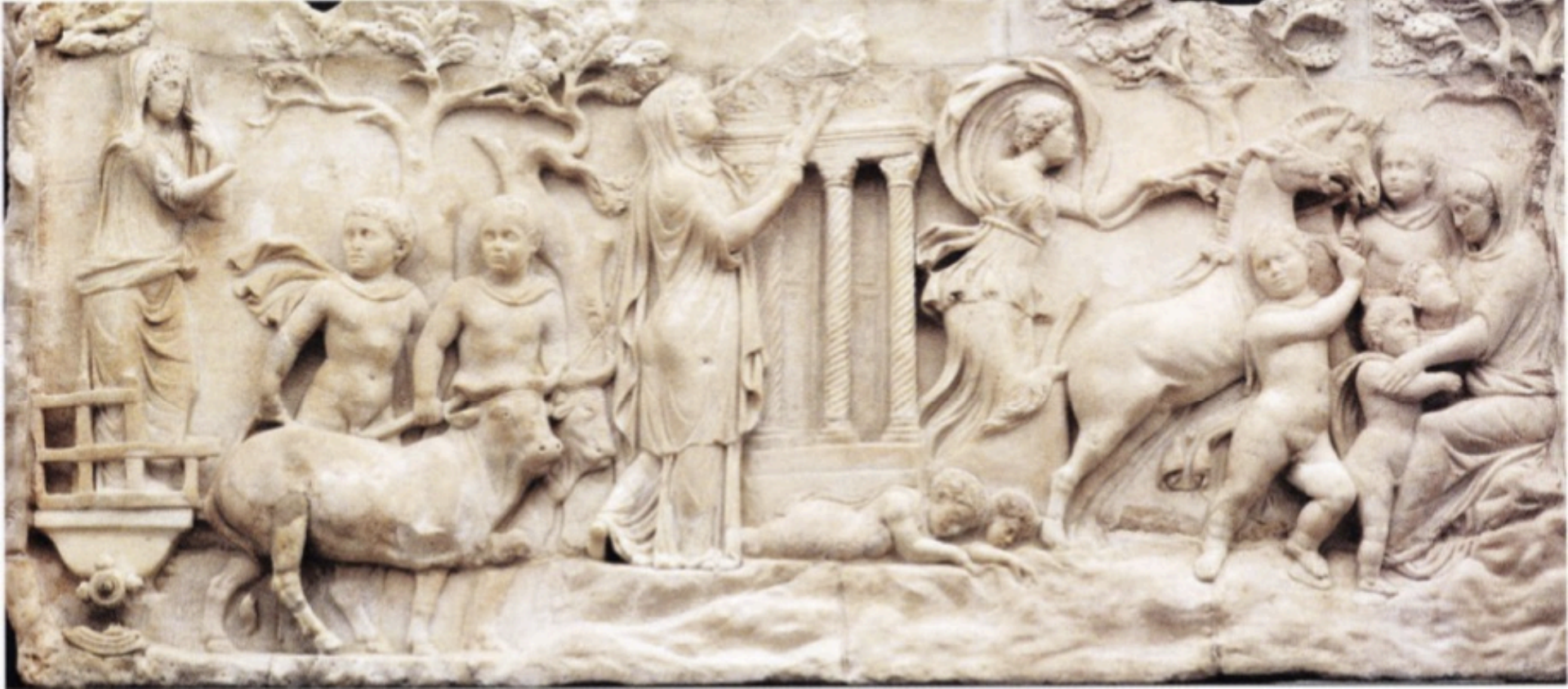
Petite stèle fermant l'entrée de la tombe de deux enfants (vers 160), et représentant Cléobis et Biton. Venise, Museo Archeologico.