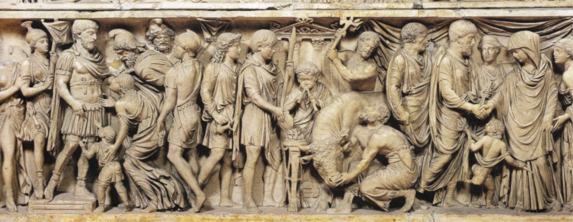
Sarcophage de type “chef militaire”, Mantoue, Palazzo Ducale, vers 170-180.