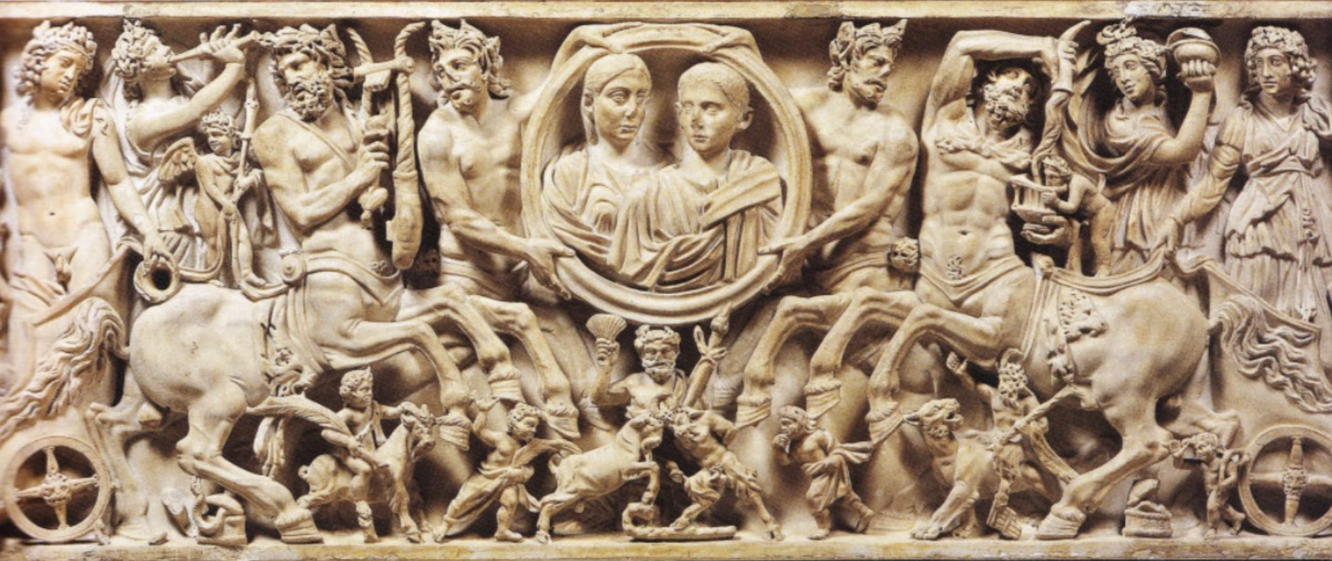
Portrait de couple dans un tondo porté par deux centaures au centre du thiasse bachique. Paris, Musée du Louvre. Vers 230.