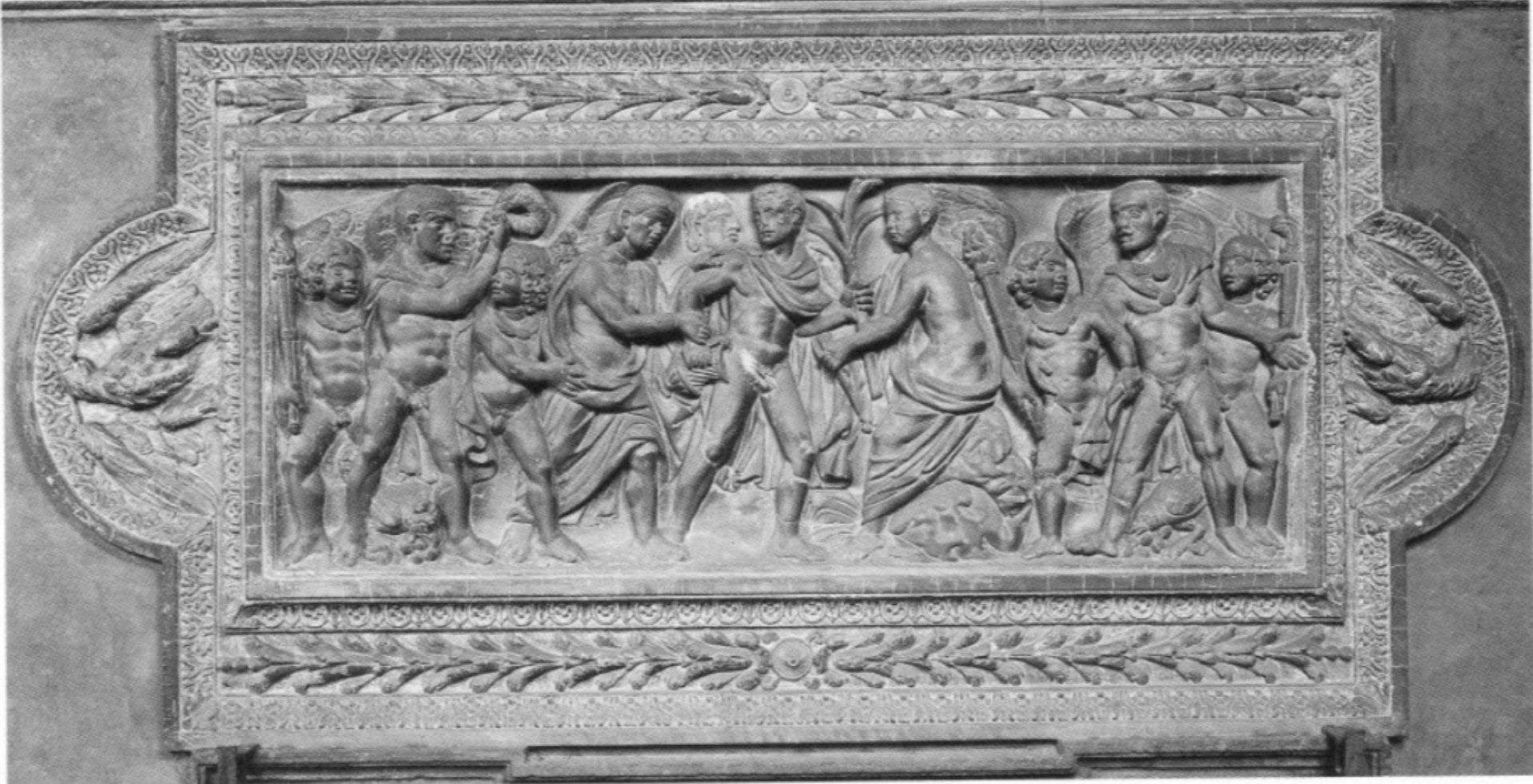
Hylas et les nymphes, Rome, Palazzo Mattei (avant le milieu IIIe s.).