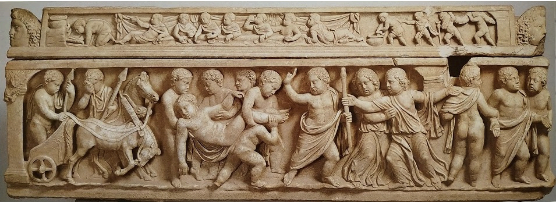
Sarcophage d'enfant avec scène de la mort de Méléagre, Bâle, Musée d'art antique, vers 160.