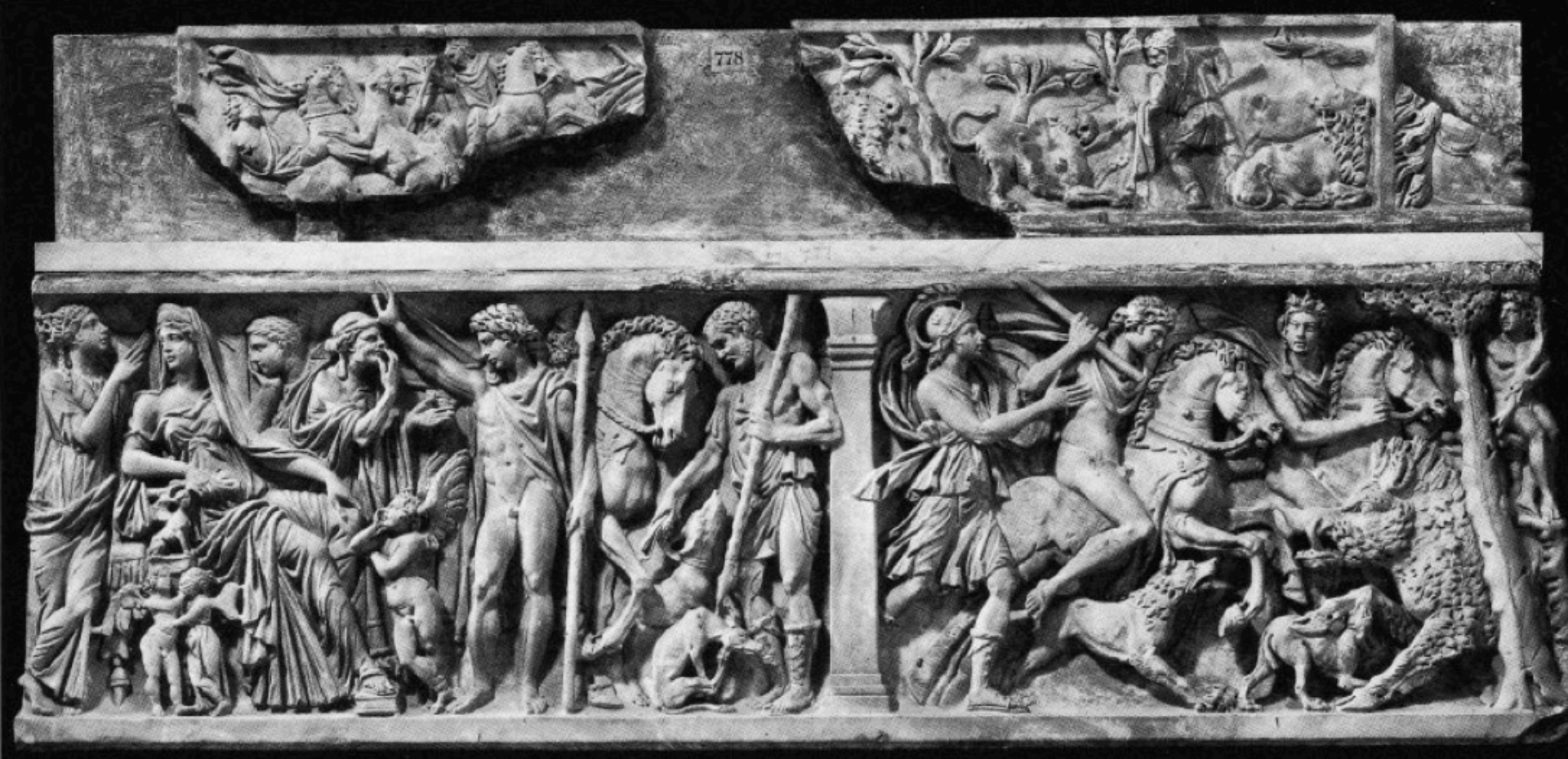
Sarcophage représentant Hippolyte et Phèdre, début IIIe s., Vatican, Museo Gregorio Profano.