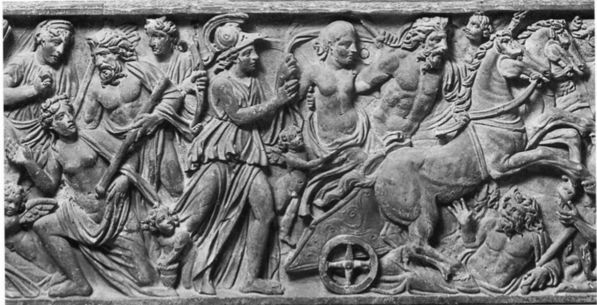
Enlèvement de Perséphone, Rome, Musée du Capitole, 249. Vers 230-240.