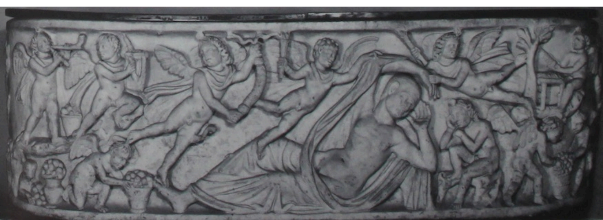
Sarcophage de la seconde moitié du IIIe s. : Ariane retravaillée en Endymion (Londres, British Museum, 1947.7-14.8).