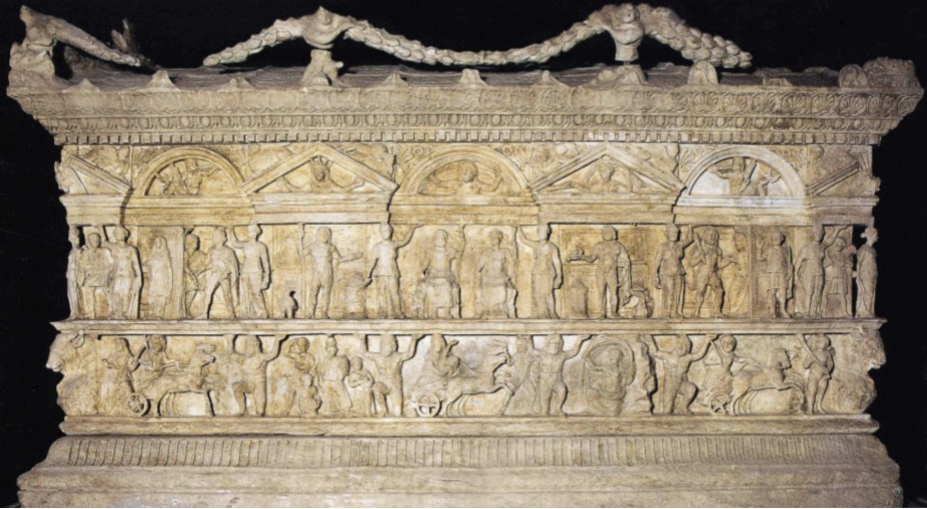
Sarcophage de Velletri, Musée archéologique, milieu IIe s. ap. J.-C.