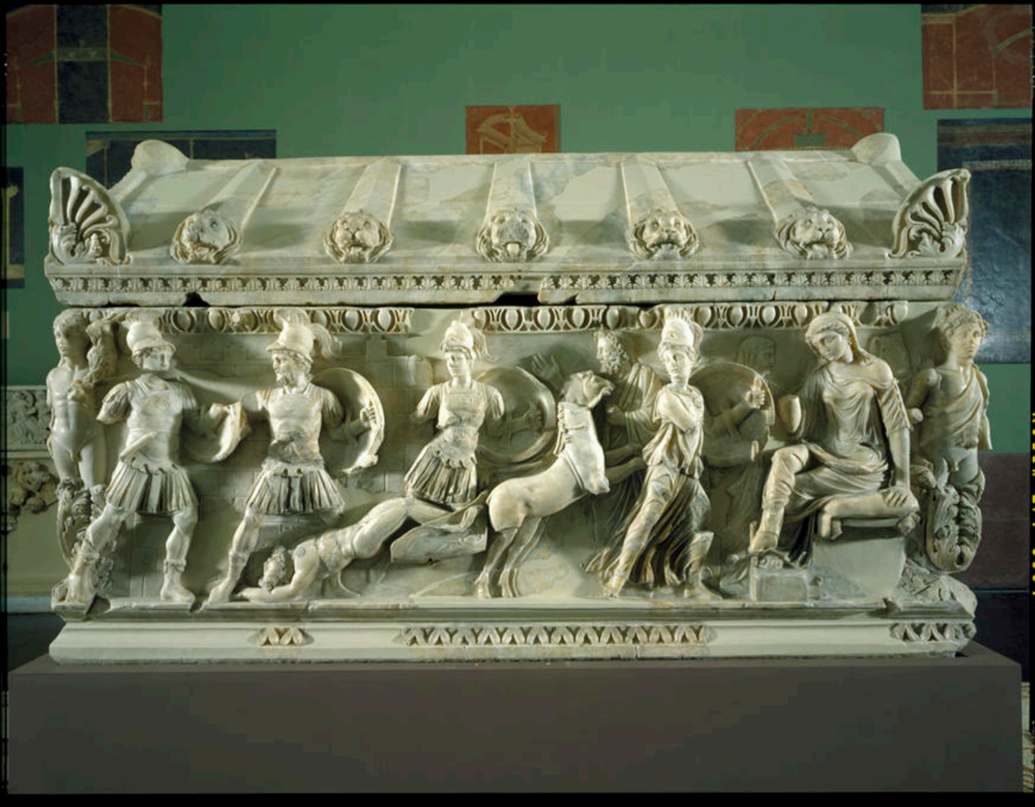
Sarcophage de Dokimeion (Phrygie), Rhode Island School of Design Museum, 21.074 (Ile s. ap. J.-C.)