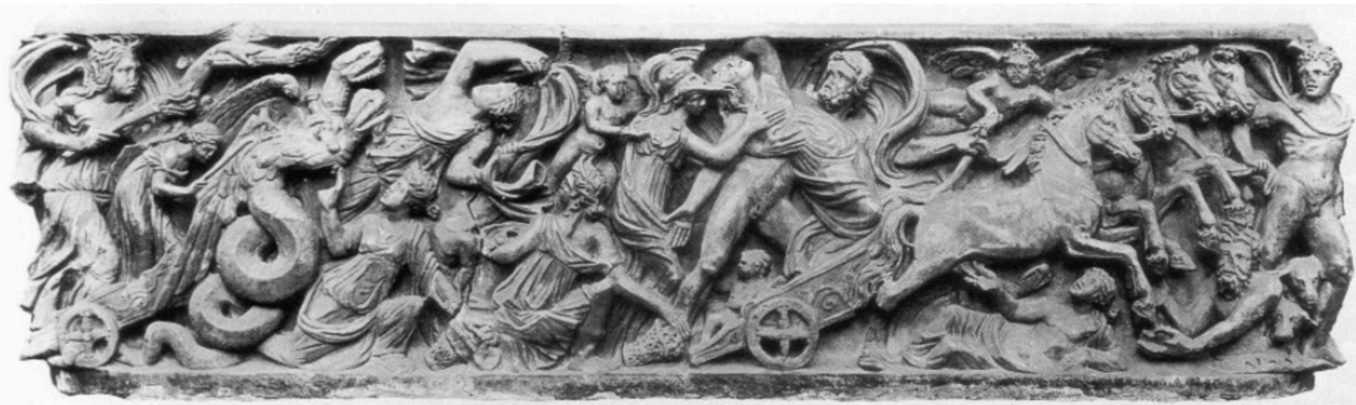
Sarcophage de Proserpine, Trésor de la cathédrale d'Aix-la-Chapelle (1er quart du IIIe s. ap. J.-C.)