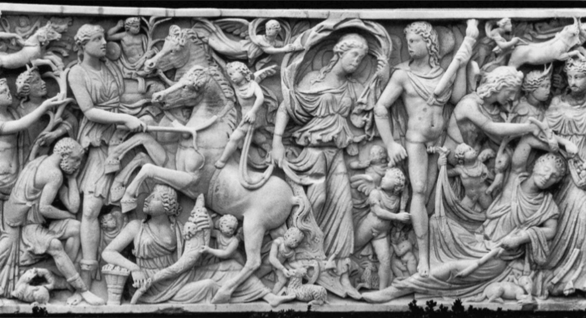
Sarcophage à motif d'Endymion et Séléné, Cliveden (Buckinghamshire), Astor collection, vers 240 ap. J.-C.