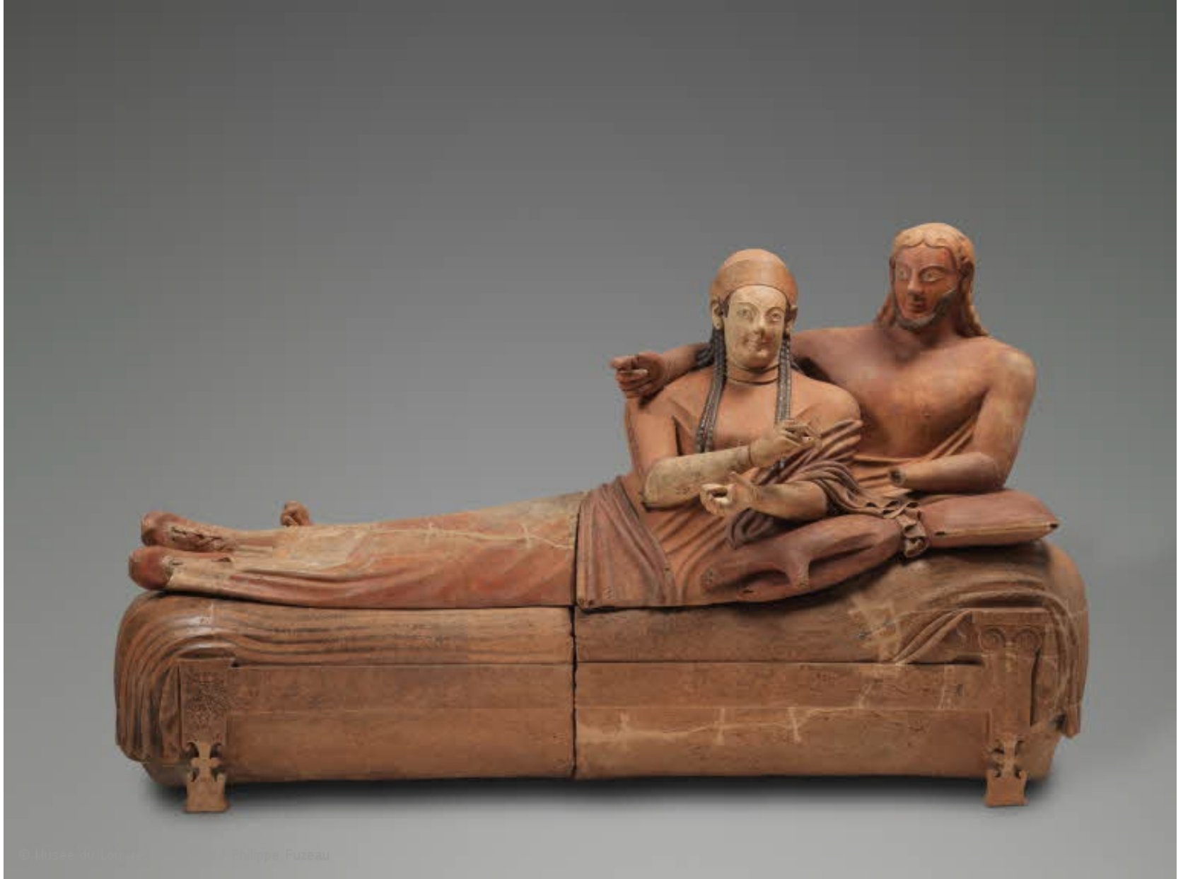
“Sarcophage des époux”, Musée du Louvre, Cp 5194, fin VIe s. av. J.-C.