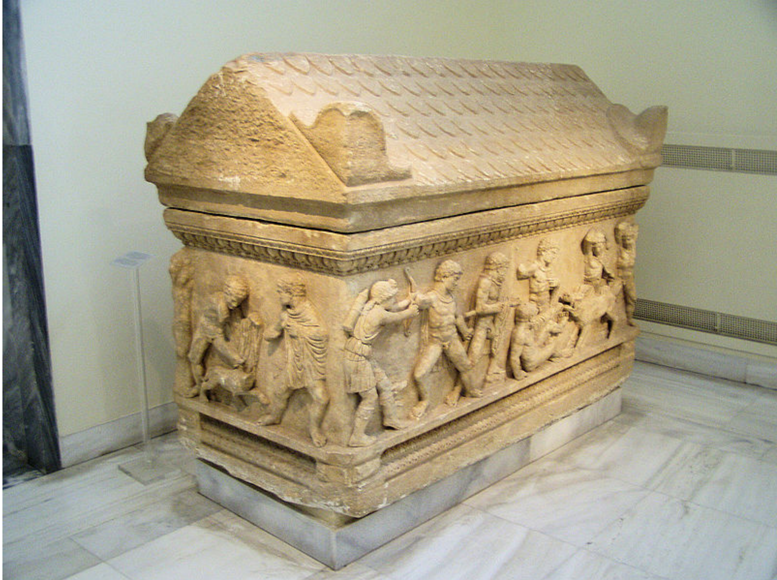
Sarcophage attique (chasse du sanglier de Calydon), Athènes, Musée archéologique, 1186 (2e quart du lie s. ap. J.-C.)