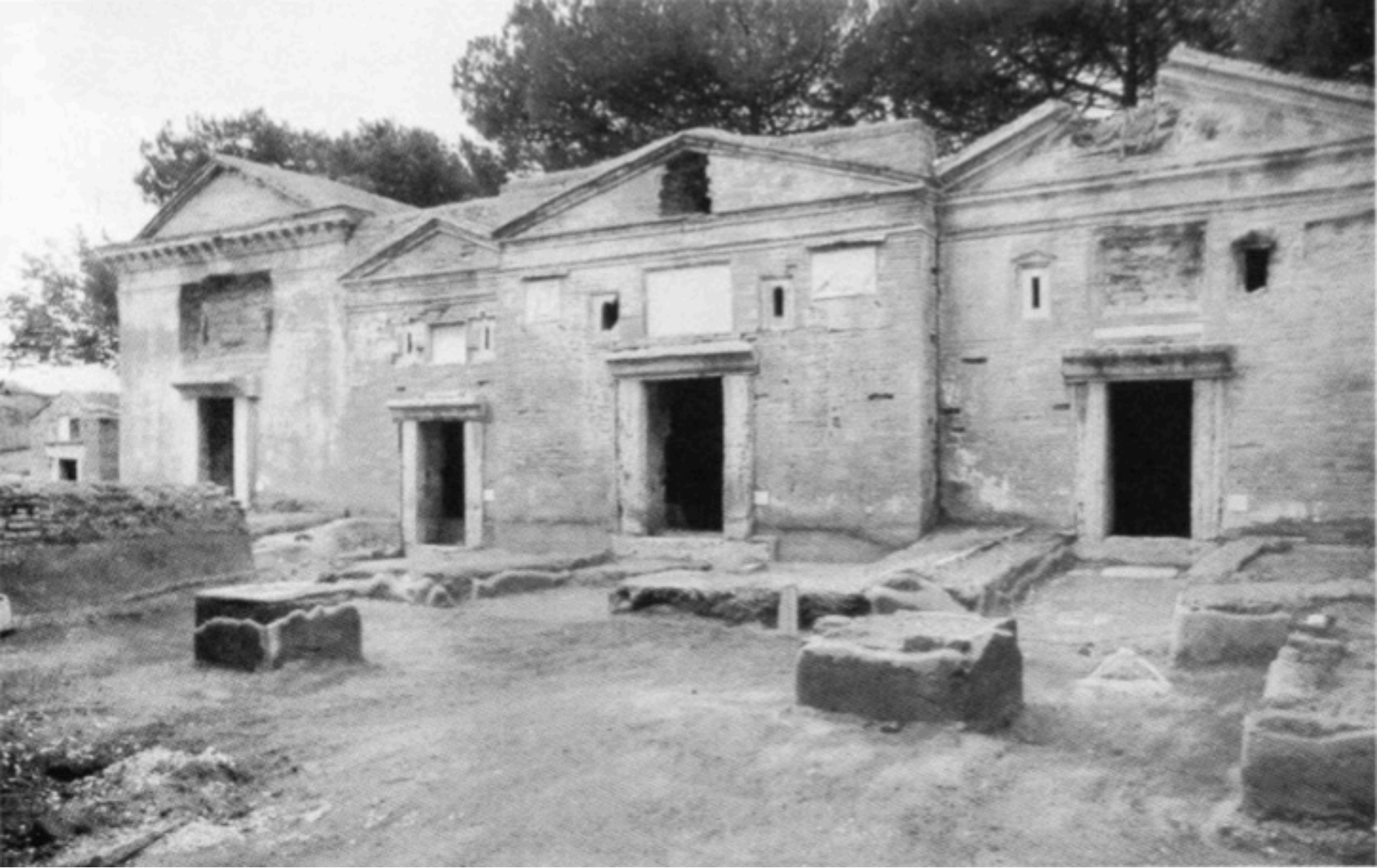
Isola Sacra (Ostie), chambres funéraires