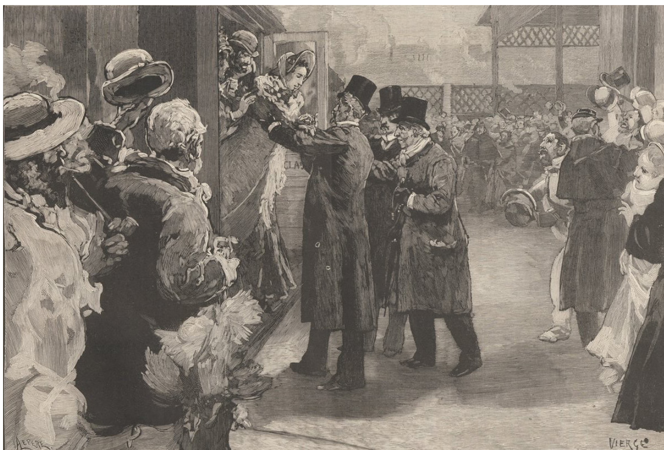
Louise Michel à son arrivée à la gare Saint-Lazare», gravure de Daniel Vierge, Source : Le Monde Illustré, journal hebdomadaire, Paris, 13 septembre 1879, n° 1172, p. 165.